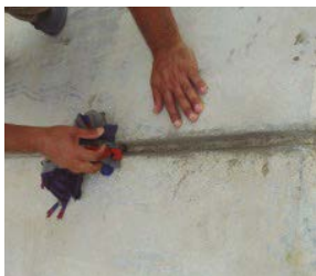
1 Limpieza de la superficie de la junta