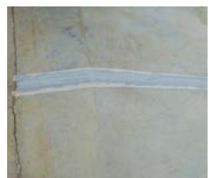
8 Acabado final. Retirar Cinta masking tape.