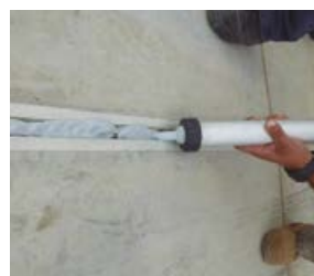
6 Se puede aplicar de manera manual o con pistola neumática.