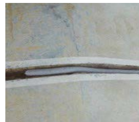
3 Colocar PER BACKER ROD en la junta como material de respaldo