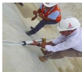
5 Pasamos a aplicar SUPERFLEX PU 40