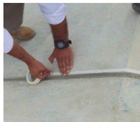
2 Opcional: Se colocara una cinta masking tape