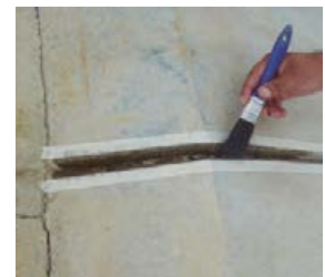
4 Aplicar imprimante PER PRIMER POX o PER PRIMER 75