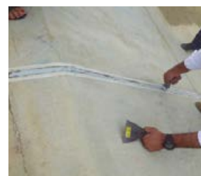
7 Se termina la aplicación nivelando con una espátula y retirando los excesos con la misma